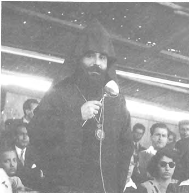
Չարեհ Սրբապան Փայասլեան (հետագային Կաթողիկոս Մեծի Տանն Կիլիկիոյ) 1946ին պաշտօնական բացումը կը կատարէ Հ.Մ.Ը.Մ.ի նշանատուր «Նաւասարդեան» դաշտին:

«...Հիմա, Ի. դարու մէջ, մեր դարու այնքան բազ- մաթի՛ւ գիտերէն վերջ, մարմնական քաջութիւնը, ֆի- զիքական ոյժի արտայայտութիւնը այնքան մեծ արժէք