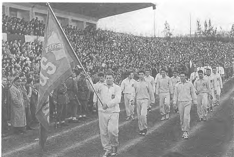
1959 Գահիրեի Հ.Մ.Ը.Մ. «Արարատ»ի մարզիկները Հալեպի միջ-մասնաճիղային 33րդ մարպախաղերուն