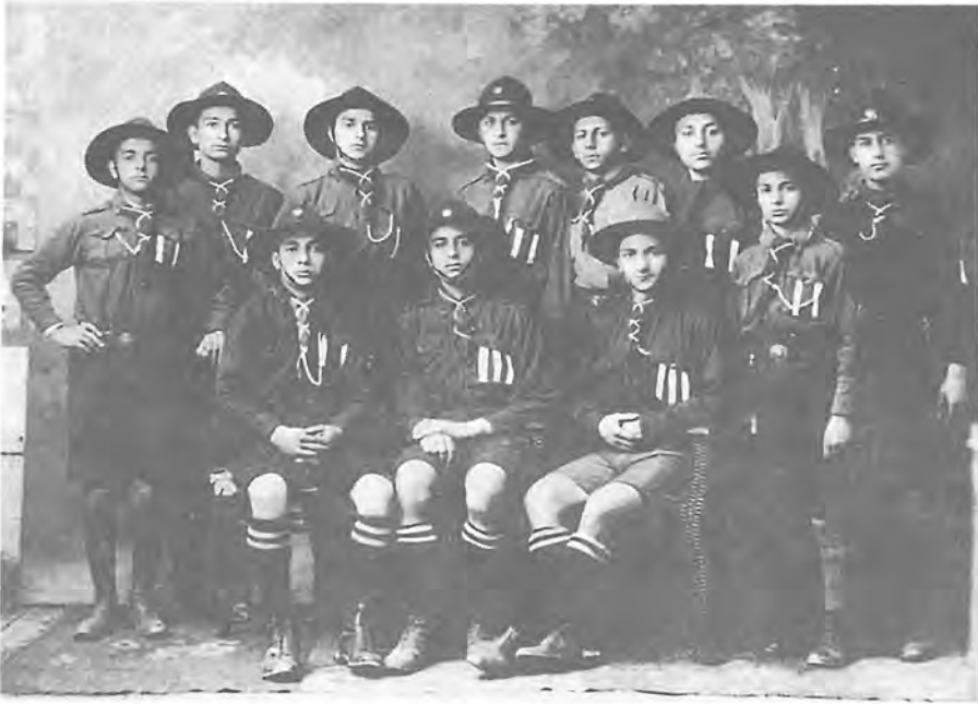
Պուրբեշի Հ.Մ.Ը.Մ.ի Մասնաճիղի սկսուտ առաջնորդները, 1925ին: Ուռքի, աջէն երրորդը՝ Կարապետ Լեւոն Պալճեան (ապա՝ Վապգէն Ա. Կաթողիկոս Ամենայն Հայոց):

«Այս պահին ես շատ յուզուած եմ, որովհետեւ նախ լսեցի ձեր խօսքը, երգը եւ փոքրիկ ֆիլմը, որ ցոյց էր տալիս ձեր բանակումի կեանքի մի հատուած: