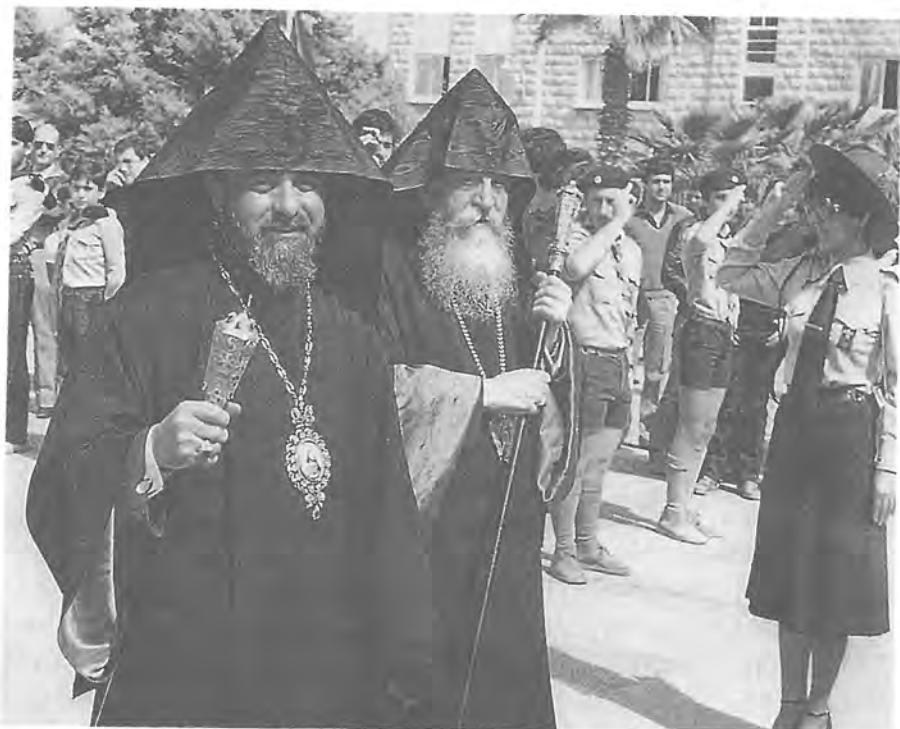
Պատուի՛ ա՛ն - Վեհափառները կը ժամանեն (Ն.Ս.Օ.Տ.Տ. Խորէն եւ Գարեգին Բ.)

Օրսֆորտի ուսանող թէ Դպրեվանքի տեսուչ, Հ.Ե.Հ.Ռ.Մ.ի հինգերորդ թէ Եկեղեցիներու Համաշխարհային Խորհուրդի փոխատենապետ, Նոր Զուղայի թէ Նիւ Եորքի Առաջնորդ, Մեծի Տանն Կիլիկիոյ թէ Ամենայն Հայոց Կաթողիկոս, Գարեգին Վեհափառ եղաւ ու մնաց Հ.Մ.Ը.Մ.ի իտեալներուն եւ արժէքներուն մեծ հաւատաւորը: Սիրե՛ց Հ.Մ.Ը.Մ.ը իբրեւ ոգի, մթնոլորտ, միջավայր եւ կազմակերպութիւն, որովհետեւ Հ.Մ.Ը.Մ.ականութեան մէջ տեսաւ «Յարգանքի, հնազանդութեան, ծառայութեան եւ նուիրումի» սկզբունքներուն մարմնաւորումը: