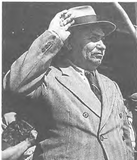
Հ.Մ.Ը.Մ.ի Հայէպի «Նաւասարդեան» դաշտի բացումին (1946), Դրօ բարեւկանգնած՝ տողանցող սկաուտներուն եւ մարպիկներուն:

յաղթանակի ու հպարտութեան ծարաւի մեր ժողովուրդը, որ որոտընդոստ ծափերով կ'ողջունէ երէկի իր հրամանատարին, քաղաքական դէմքին եւ ահաբեկիչին հռետորաշունչ խօսքերը՝ իր հետ տանելով պատգամ հայրենի լեռներէն, դաշտերէն ու ամալացած քաղաքներէն: Ո՛րքան տպաւորիչ եղած է իր խօսքը, նո՛յնքան եւ անելի՝ զինուորականի իր բարեւը՝ ի տես տողանցող, շարան առ շարան, սկաուտական խումբերուն, նորօրեայ մեր «կամաւոր բանակ»ներուն: