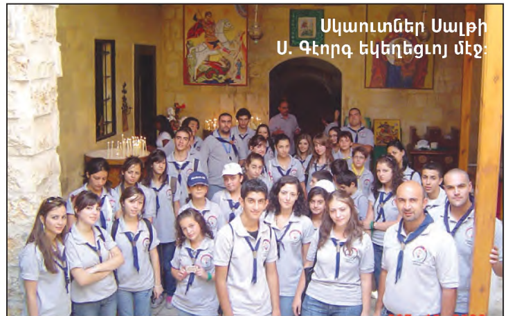
Սկաուտներ Սալթի Ս. Գեորգ եկեղեցույ մեջ:

Երեկոյեան, սկաուտներ տուն վերադարձան պատմական օրուան մը անջնջելի յիշատակներով: