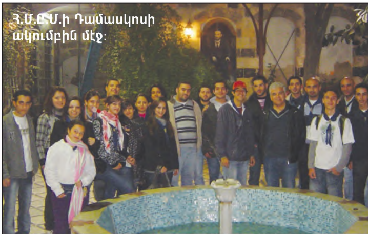
Հ.Մ.Ը.Մ.ի Դամասկոսի ակումբին մեջ: