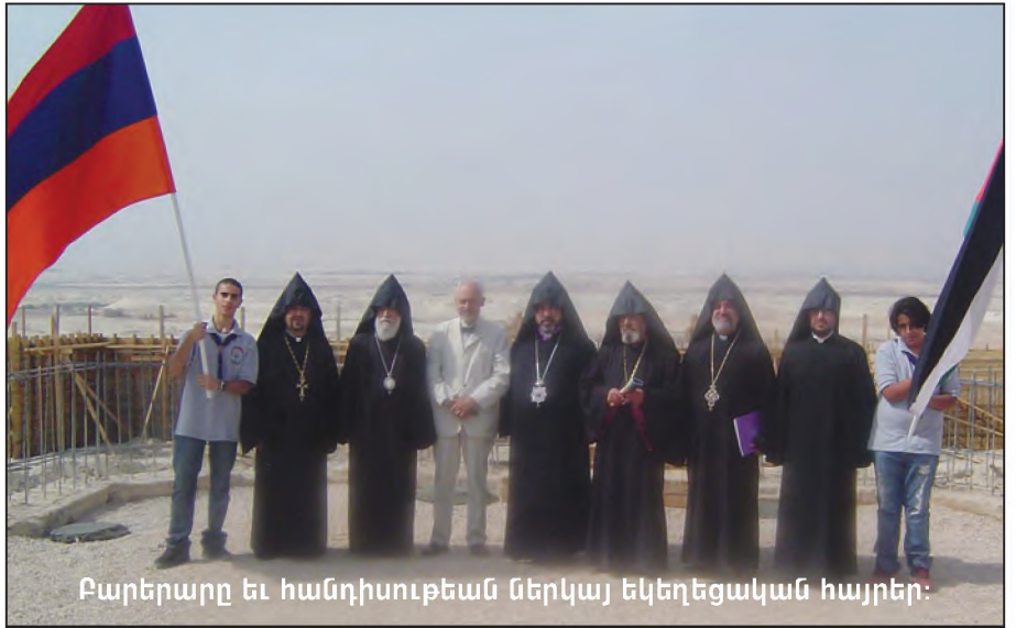
Բարերարը եւ հանդիսութեան ներկայ եկեղեցական հայրեր: