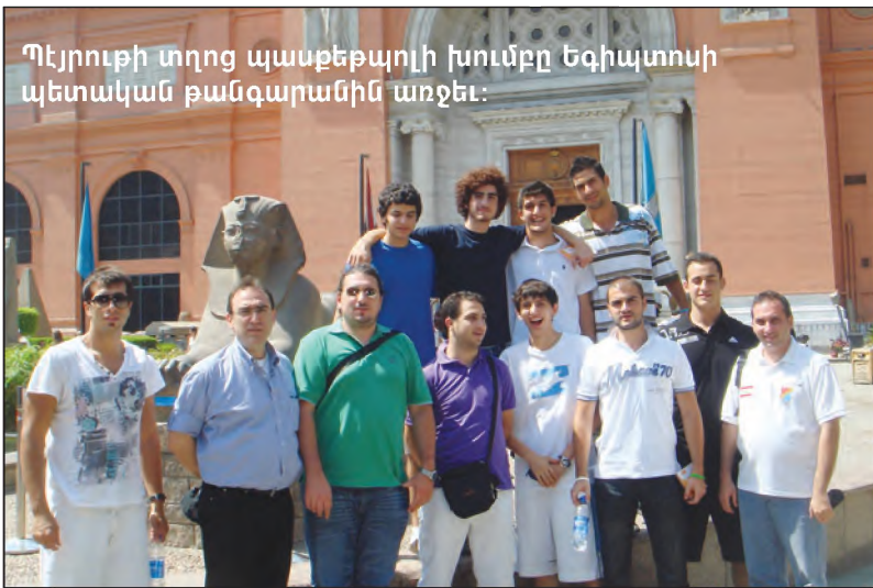
Պեյրուսի տղոց պատրաստողի խումբը Եգիպտոսի պետական թանգարանին առջև:

Երէջ տղոց մրցումներուն աւրնթեր, Հ.Մ.Ը.Մ.-«Արարատ»ի 14 եւ 12 տարեկանէն վար տղոց խումբերը բարեկամական մրցումներ կատարեցին տեղական խումբերու դէմ: 14 տարեկանէն վար տղոց խումբը 79-18 արդիւնքով պարտութեան մատնեց Փեթրոսփոր խումբը եւ տիրացաւ տէր եւ տիկին Յա-