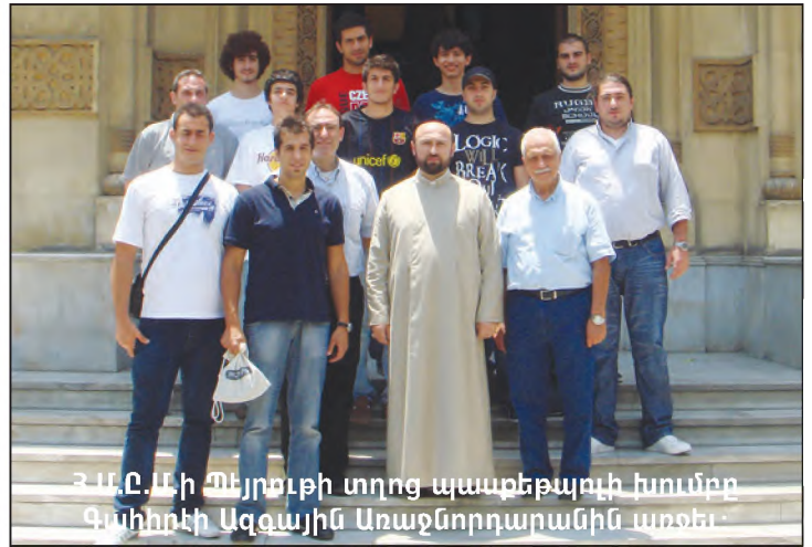
Հ.Մ.Ը.Մ.ի Պեյրուսի տղոց պատրաստողի խումբը Գալիտի Ազգային Առաջնորդարանին առջև:

Գագանճեանի յիշատակին: Մրցումներու աւարտին, Հ.Մ.Ը.Մ. Պէյրուսի տիրացաւ երկու բաժակի, մինչ դաշտի տէրերը բաւարարուեցան մէկ բաժակով: