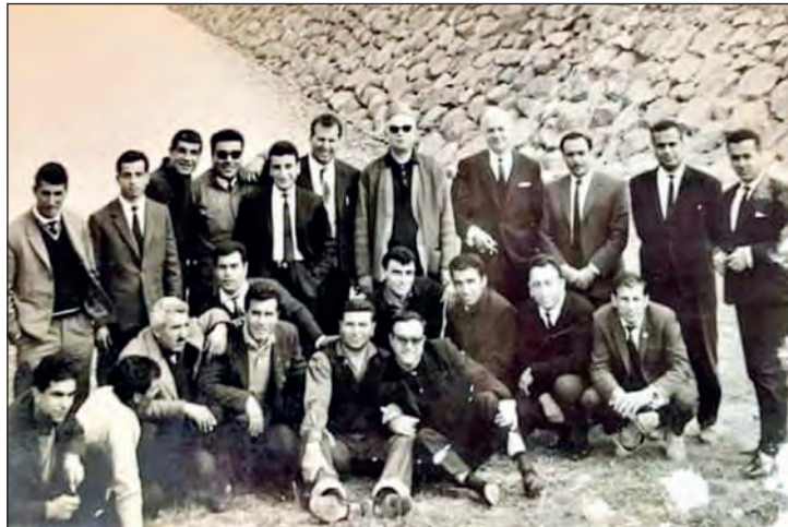
18 Մարտ 1965. Բ.Մ.Ը.Մ.ի Հալէպի պատուիրակութիւնը Դամասկոս մեկնումի ձամբոն վրայ:

Համեստ փորձառութենէն մեկնած կը խնդրեմ բոլոր պատասխանատուներէն եւ մարզիչներէն կարեւորութեամբ նկատի ունենալ այս լուրջ պարագան եւ զգոյշ ըլլալ նման ան-