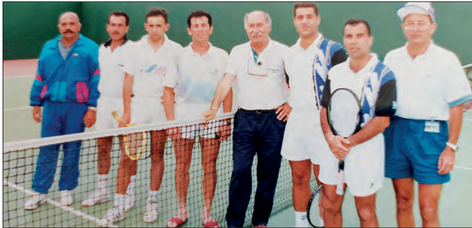
1985. Դամասկոս, թենիսի մրցաշարքի մը ընթացքին: