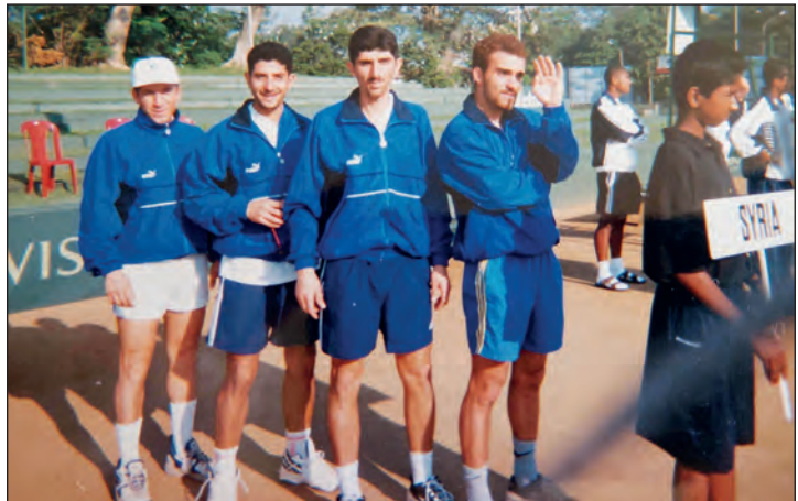
1984. Դամասկոսի Աբասեաններու թենիսի դաշտը, Սուրիոյ ախոյեանութեան մրցումի ընթացքին: