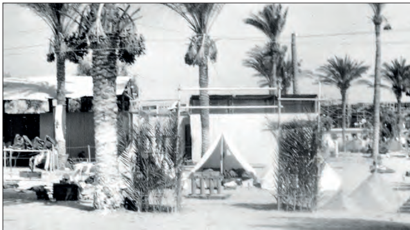
Արմաւենցիներով ու արմաւով հարուստ լիբանանեան մեր բանակավայրը եւ մուտքին դիմաց վրանս եւ խմբակիս ձեռային աշխատանքը՝ Լիբանանի խորհրդանշներէն Պաալպէի սիւները եւ աջին՝ բուրգերը:

Աղեքսանդրիոյ պատմութեան մասին կարգ մը յատկանշական գիտելիքներ--