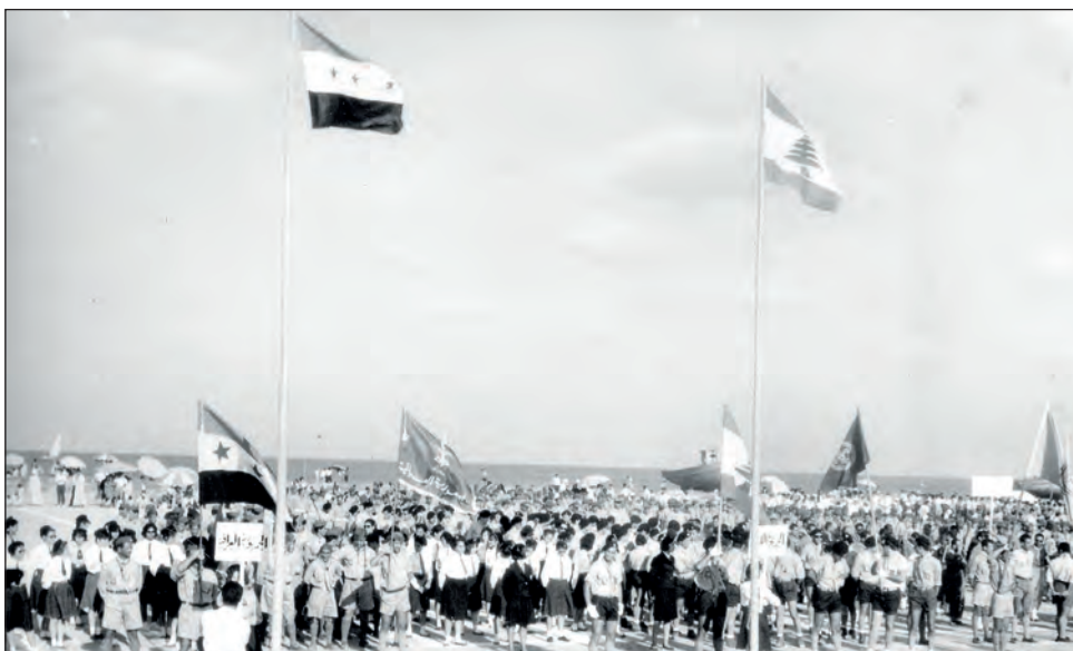
Բանակումի ընդհանուր հաւաքէն տեսարան մը. Լիբանանի եւ Իրաքի սկաւառները քով-քովի, ետին՝ Միջերկրական ծովը:

Մքանչելի է ամբարն Միջերկրական ծովու խորերուն կապոյտը, գոր կարելի չէ նկարագրել: Յաջորդ առտու, կարճ ժամանակ, տեսանք խումբ մը դելիիններ, որոնք ընկերակցեցան նաւուն, մերթ սուզուելով, ապա ծովէն դուրս ցատկելով: