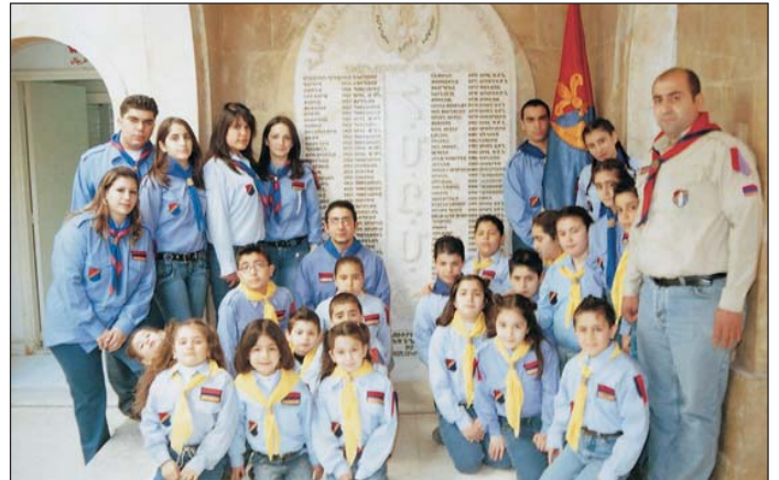
Հ.Մ.Ը.Մ-ի Տէր Զօրի սկստական կորիչի անդամներ:

Կորիչը կը վայելէ Ս. Նահատակաց եկեղեցւոյ թաղականութեան նիւթաբարոյական օժանդակութիւնը: