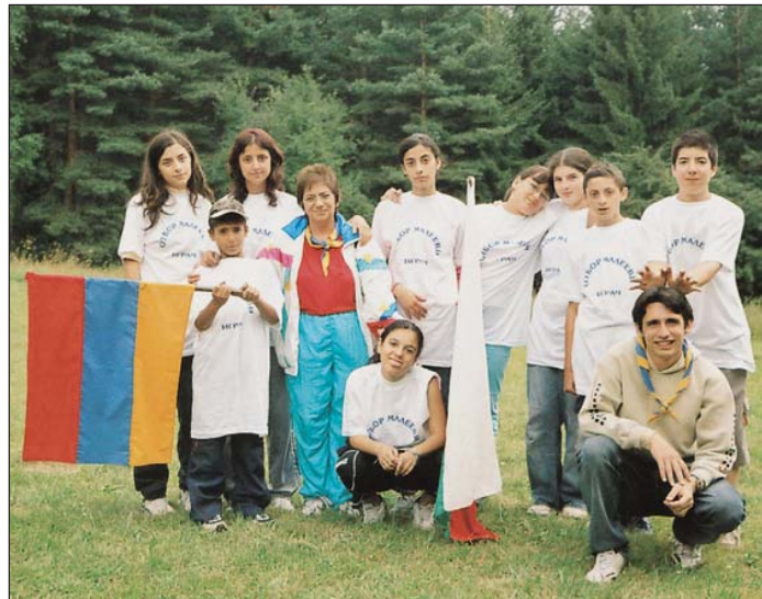
Իկլիքա. բանակումի մասնակիցներ:

Կ'ընդունինք, որ ցարդ չյաջողեցանք տղոց հայերէն խօսելու վարժութիւն տալ, բայց այդ կարելի չէ, երբ ծնողները իրենք տան մէջ չեն գործածեր մայրենի լեզուն: Հակառակ որ Հ.Մ.Ը.Մ-ի մէջ հայկական ջերմ միջավայր ստեղծելով որոշ գոհացում կը ստանանք: Բայց, ցա-