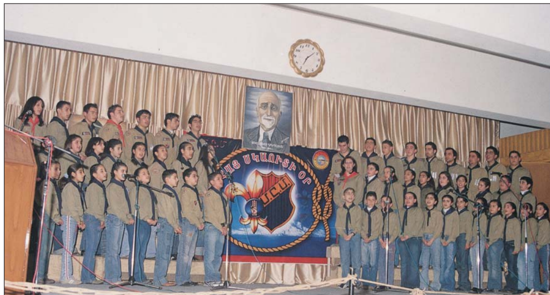
Սկառուտական երգչախումբը ելոյթի պահուն: