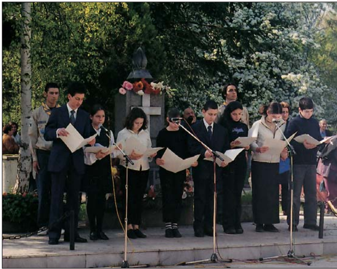
Մեծ Եղեռնի յուշարձանին առջեւ գրական մատուցում:

Պուլկարիոյ Հ.Մ.Ը.Մ-ը նոր օրերու իր վերածնունդը դիմաւորեց 1991ին եւ վերանորոգեց իր ուխտը՝ ծառայելու Հայաստանին: Այսպէս, 27 Մարտ 1991ին վերականգնեցաւ Սոֆիայի մասնաճիւղը, 15 Սեպտեմբերին՝ Փլովտիվի, 21