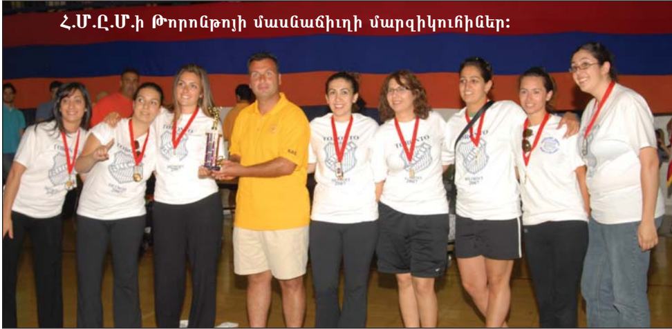
Հ.Մ.Ը.Մ.ի Թորոնթոյի մասնաճիւղի մարզիկուհիներ: