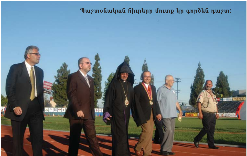
Պաշտօնական հիւրերը մուտք կը գործեն դաշտ:

Եղբայրը ուրախութեամբ յայտարարեց, թէ ներկայիս աշխարհի տարածքին