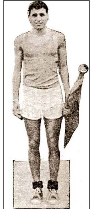
ԵՂԲ. Պ. ԲԱՆԻԿԵԱՆ

'Made from one single slice of natural Australian opal'