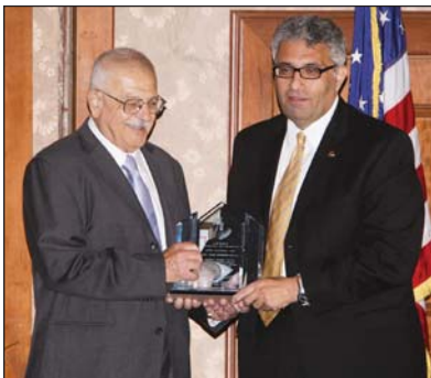
սակարկ նուիրումն ու ներդրումը Հ.Մ.Ը.Մ.ի շարքերէն ներս, «Տիպար Հ.Մ.Ը.Մ.ական - 2007»ի տրոփումը շնորհեց իրեն: Այս ուրախ առիթով «Մարզիկ» հանդիպում մը ունեցաւ երօր հեղ:

Ատենապետը նաեւ յատուկ հպարտութեամբ յայտարարեց եւ շնորհաւորեց շրջանի Հ.Մ.Ը.Մ.ի մեծագոյն մասնաճիւղը՝ Կլէնտէյլի «Արարատ»ը, որ երկրորդ կեդրոնատեղի մը գնելու յանձնառութեան տակ մտած է, ինչ որ մեծապէս պիտի նպաստէ շրջանի Հ.Մ.Ը.Մ.ի մեծագոյն մասնաճիւղին