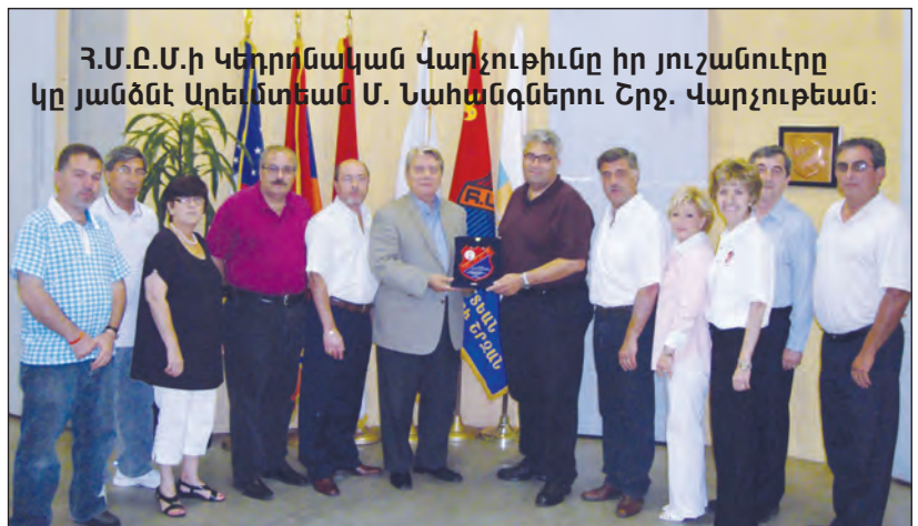
Հ.Մ.Ը.Մ.ի Կեդրոնական Վարչութիւնը իր յուշանուէրը կը յանձնէ Արեւմտեան Մ. Նահանգներու Շրջ. Վարչութեան:

րահնչին երգեցին «Յառաջ նահատակ» քայլերգը, ապա մեկնեցան գերեզմանատուն, այցելելու ազգային հերոս Միսաք Թորլաքեանի շիրիմը: Դամբանաքարին շուրջ խմբապետութեան անդամները լուռ հետեւեցան եղբ. Արի Պոյաճեանին, որ ամփոփ գիծերու մէջ ներկայացուց Թորլաքեանի նուիրագործումները եւ ազգային պարտաւորութեան կոչին սրբագործումը: Կեդրոնական Վարչութեան անդամները ծաղկեփունջ մը զետեղեցին Միսաք Թորլաքեանի շիրմաքարին