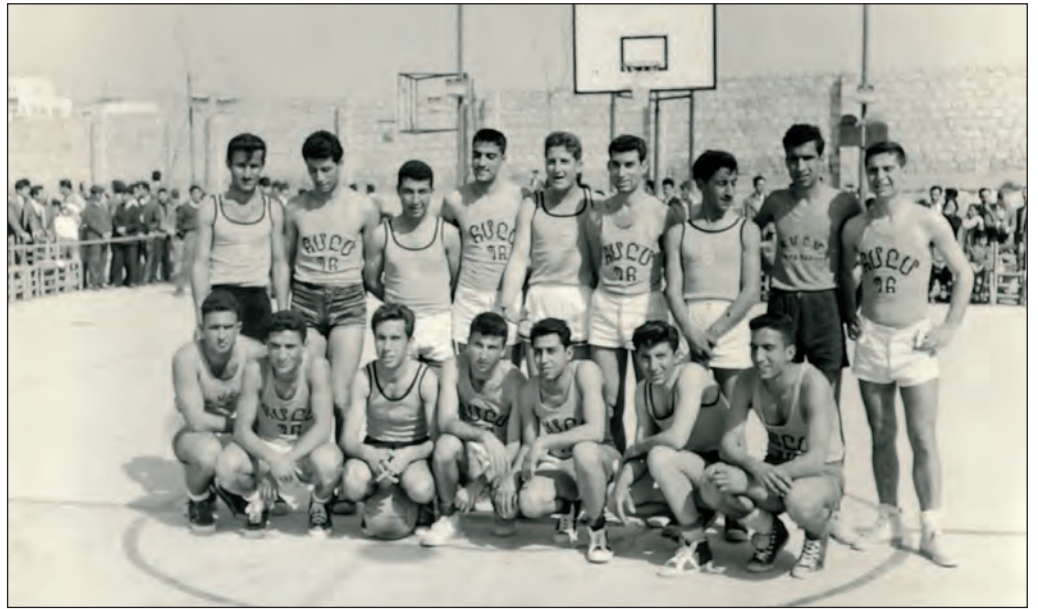
Հ.Մ.Ը.Մ-ի Պուրճ Զամուտի պասքէթպոլի տղոց...

«Անդամներուն շարքերը հետզհետէ խտանալով եւ աւելի զօրեղ թափ ու կորով ստեղծելու միակ նպատակաւ, վար-