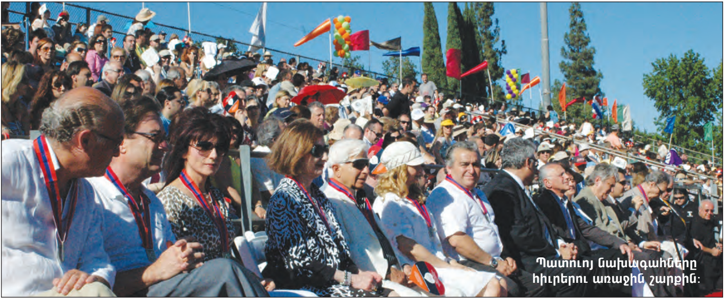
Պատուոյ նախագահները հիւրերու առաջին շարքին: