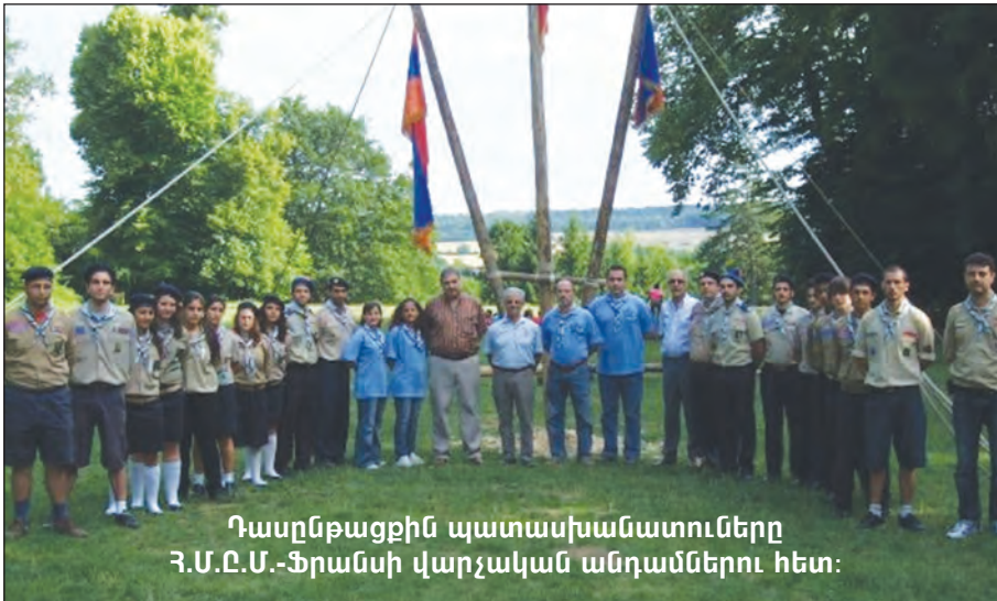
Դասընթացքին պատասխանատուները Հ.Մ.Ը.Մ.-Ֆրանսի վարչական անդամներու հետ: