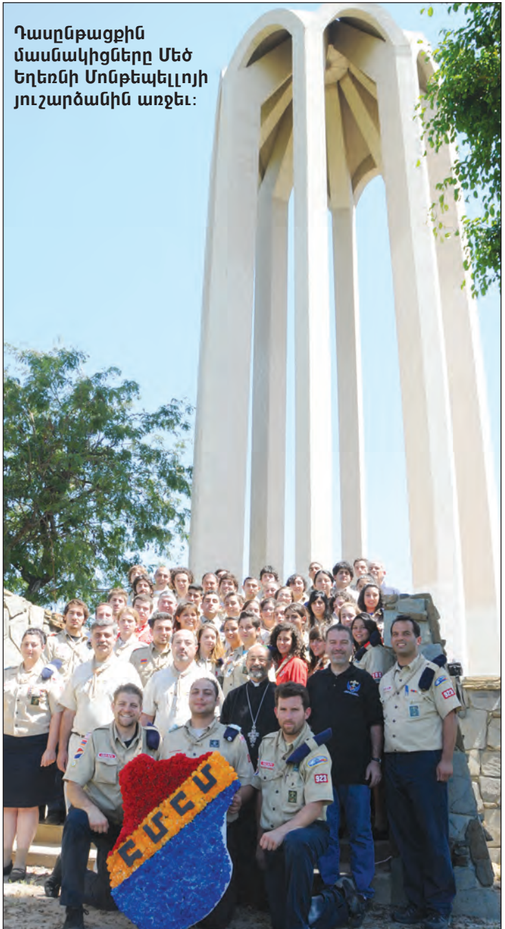
Դասընթացքին մասնակիցները Մեծ Եղեռնի Մոնթեպելլոյի յուշարձանին առջեւ: