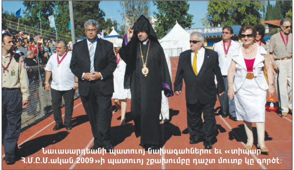
Նաւասարդեանի պատուոյ ճախագահներու եւ «տիպար Հ.Մ.Ը.Մ.ական 2009»ի պատուոյ շքախումբը դաշտ մուտք կը գործ: