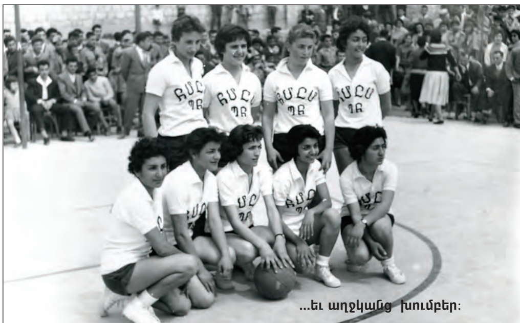
...եւ աղջկանց խումբեր:

«Հ.Մ.Ը.Մ-ի նուիրական ծրագրին ընդառաջ երթալ կարենալու համար, անոր կը պակսի նիւթական միջոց, հետեւաբար որոշեց բացառիկ հանգանակութիւն մը ընել իր անդամներուն մէջ եւ մասնաւորապէս բանալ պատուոյ անդամակցութեան ցանկ մը, որուն պատուոյ նախագահութիւնը Ընդհ. ժողովս Զերդ Գերապատութիւնը որոշած ըլլալով, մեծ հաւատք ունիմք որ յառաջապահը պիտի ըլլայիք սատարելու այս բարձր գործին: