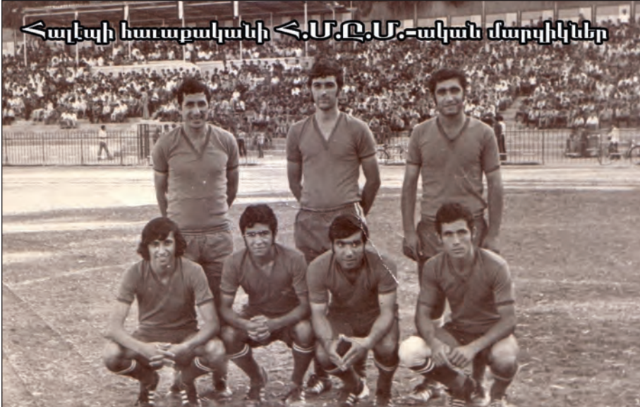
Հալէպի հաւաքականի Հ.Մ.Ը.Մ.-ական մարզիկներ

Մրցումներու ընթացքին Հ.Մ.Ը.Մ.ի ֆութպոլի դաշտը համակիրներով կը լեցուէր եւ առաջին երեք դիրքերը գրաւող խումբերը կը վարձատրուէին յատուկ մետալներով եւ բաժակներով: Այսօր մենք սկաւառ եղբայրներու մէջ կը տեսնենք ֆութպոլ խաղալու իղձը, սակայն կը հանդիպինք հիմնական դժուարութեան մը, որն է՝ դաշտի չգոյութիւնը: Մենք եթէ կ'ուզենք լաւ մարզիկ ունենալ, պէտք է ու-