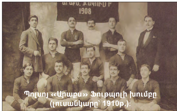
Պոլսոյ «Արարատ» Ֆութպոլի խումբը (Լուսանկարը՝ 1910թ.):

Առանձնակի յիշատակութեան է արժանի 1914 թ. Ապրիլին Չորք Մարզպանի հարաւում դաշտահանդէսի համար յատուկ պատրաստուած վայրում՝ Կիլիկեան ողիմպիական խաղերի եւ մարզահանդէսի կազմակերպումը: Կիլիկիայի մարզական կեանքում այդ բացառիկ իրադարձութեանն իրենց մասնակցութիւնը բերեցին Ատանայի եւ Ալեքսանտրէթի մարմնամարզական խմբերը: Այդ յիշարժան օրը հազարաւոր հանդիսականներ, այդ թրւում՝ շուրջ չորս տասնեակ թուրք բանակային սպաներ, ներկայ գտնուեցին մրցախաղերին: