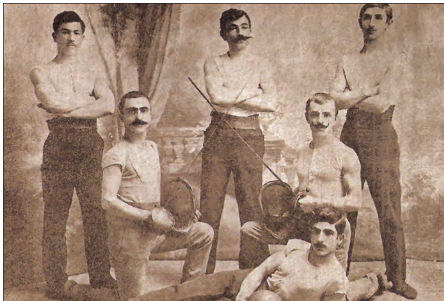
Տրապիզոնի «Արծիւ» մարմնակրթական ակումբի մարզիկներ:

Հայկական գաւառներում մարմնամարզական շարժմանը զարկ տալու կարեւորման մասին են վկայում Շաւարշ Քրիսեանի՝ ի նպաստ այդ խնդրի լուծման կազմակերպական ձեռնարկումների անհրաժեշտութեան մասին «Մարմնամարզ»ում հրատարակուած առաջարկները: Նա, ի մասնաւորի, գրում է. «Մասնաւորապէս հայկական գաւառներում մէջ անհրաժեշտ է մարմնամարզական ակումբներ կազմել. այս բանին համար կարեւոր է գաւառները վերածել շրջանակներու, որոնց կապուած ըլլան շրջակայ փոքր եւ երկրորդական քաղաքները եւ գիւղերը, ինչպէս Վանի, Էրզրումի, Սեբաստիոյ եւ այլն շրջանակ, որոնք իրենց կարգին կեդրոնին պիտի կապուին: Ընդհանուր հայկական ողիմպիականներու համար որոշուած թուականներէն քանի մը ամիս առաջ, նկատի ունենալով տեղական պայմանները, շրջանակային մարզական խաղեր կազմակերպել կեդրոնէն ուղարկուած հրահանգներու համաձայն, եւ այդ մասնակի մրցումներուն մէջէն լաւագոյն-