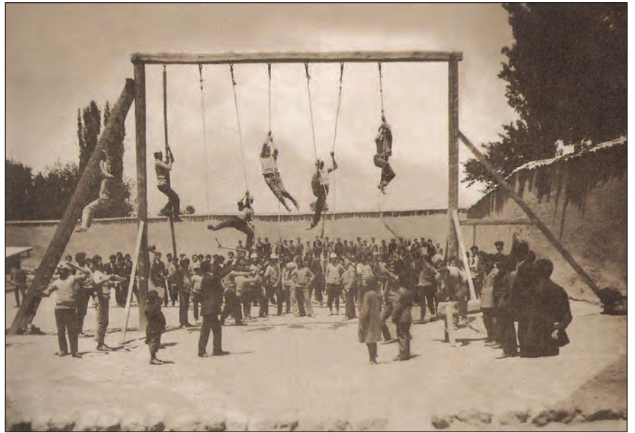
Գոնիայի Ենանեան վարժարանի սաները մարմնամարզի պահուն (20րդ դարու սկիզբ):

Այս ընթացքում Վեղիր Քէօփրիում եւ Չենկիլերում կազմաւորւում են «Արծիւ» եւ «Գայլ» մարմնամարզական ակումբները, իսկ Սիվրի Հիսարի Սահակ-Մեսրոպեան վարժարանում կազմաւորւում է «Առիւծ» խումբը: Երգնկայում 1911 թ. կազմակերպւում է Հայ Պատանեկան