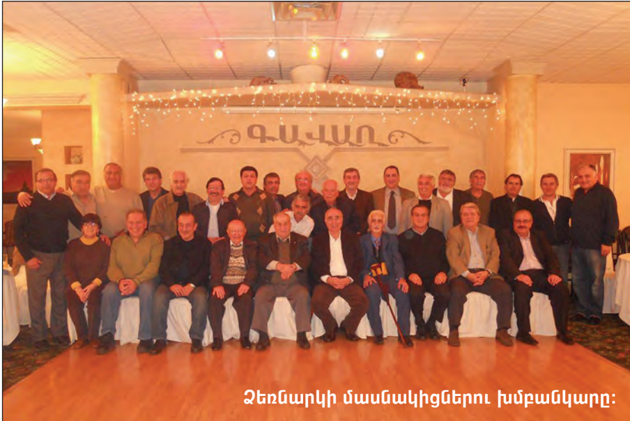
Չեռնարկի մասնակիցներու խմբաձևկարը: