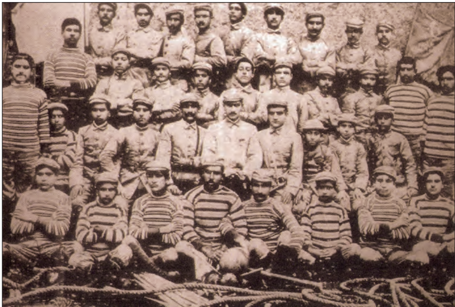
Սեբաստիոյ «Պարթեւ» մարմնակրթական ակումբի սաներ (1910ական թթ.):

Ժամանակի ընթացքում դաշտային մրցումները եւ մարմնամարզական խաղերը գաւառի ամերիկեան եւ հայկական կրթական հաստատութիւններում աւելի մեծ ծաւալում են ստանում: Մարզուանում «Անատոլիա» գոլէճի ուսանողների ջանքերով ստեղծուած են առանձին ակումբներ, որոնք հետագայում՝ 1908 թ. միաւորուելով, հիմնում են «Շաւարշան» միութիւնը: Այս միութիւնը ֆուլթայրի գուգահեռ ունէր նաեւ պէլլայրի խումբ եւ հրատարակում էր «Այգ» հանդէսը: