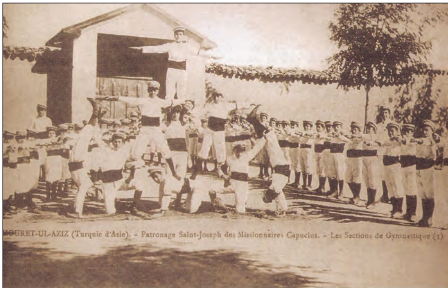
Մարզուանի «Անատոլիա» Գոլէճի մարմնամարզական խմբակի սաներ (1910ական թ.):

Այս տեսանկիւնից հետաքրքրական է Շաւարշ Միսաքեանի կարծիքը, ով Կարինի «Յառաջ» թերթում գրում է. «Մարմնամարզական վարժութիւնները օրհնութիւն մը պիտի ըլլան մեզի համար, Պոլսէն մինչեւ Հայաստան: Եւ պէտք է որ անոնց համար բան խնայենք: Ընդհակառակը մեզի համար օրուան սնունդին չափ մտահոգութիւն պէտք է պատճառէ երիտասարդներու մարմնամարզական ակումբները, անընդհատ դասընթացք մը պէտք է կազմէ մարմնակրթանքը, նոյնիսկ ցեղին բարելաւման, կամ ինչպէս կ'ըսեն, «ազգային» տեսակէտով: Հարկ է Ֆիզիքապէս շտկել մէջքե-