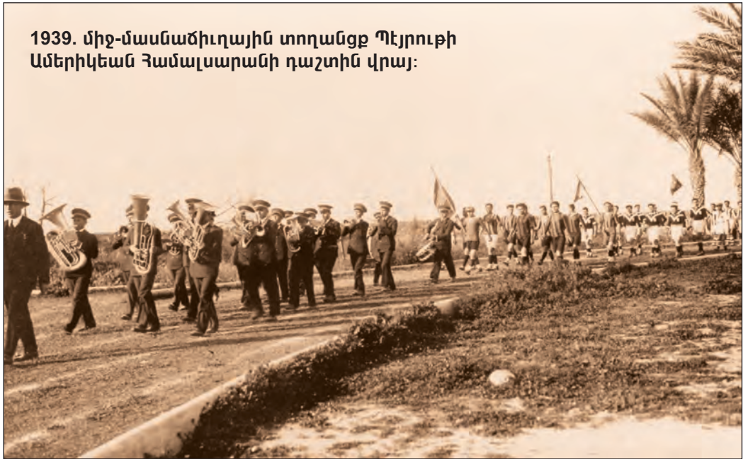
1939. միջ-մասնաճիւղային տողանցք Պէյրուսի Ամերիկեան Համալսարանի դաշտին վրայ:

մասնաճիւղերը եւ ստեղծել նախկին դրուութիւնը, այսինքն ունենալ մէկ վարչութիւն եւ մէկ մասնաճիւղ: