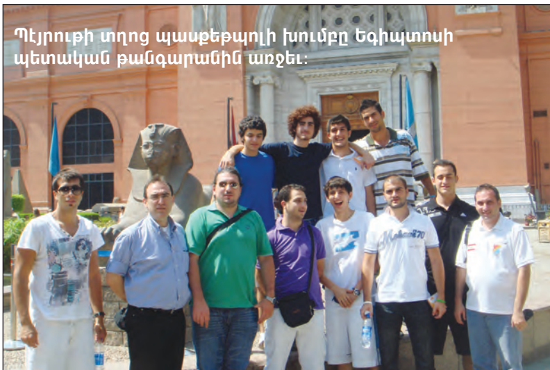
Պեյրուքի տղոց պասքեթպոլի խումբը Եգիպտոսի պետական թանգարանին առջև:

Երէջ տղոց մրցումներուն աւրնթեր, Հ.Մ.Ը.Մ.-«Արարատ»ի 14 եւ 12 տարեկանէն վար տղոց խումբերը բարեկամական մրցումներ կատարեցին տեղական խումբերու դէմ: 14 տարեկանէն վար տղոց խումբը 79-18 արդիւնքով պարտութեան մատնեց Փեթրոսփոր խումբը եւ տիրացաւ տէր եւ տիկին Յա-