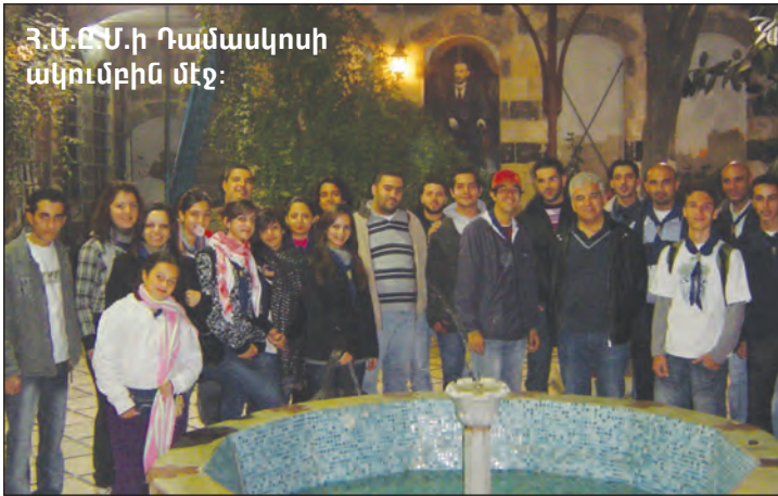
Հ.Մ.Ը.Մ.ի Դամասկոսի ակումբին մէջ: