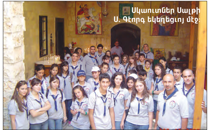
Սկաուտներ Սալթի Ս. Գեորգ Եկեղեցւոյ մէջ:

Երեկոյեան, սկաուտներ տուն վերադարձան պատմական օրուան մը անջնջելի յիշատակներով: Այլ առիթով մը, մասնաճիւղին սկաուտական խումբը մի-