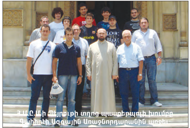
Հ.Մ.Ը.Մ.ի Պեյրուքի տղոց պասքեթպոլի խումբը Գալիոնի Ազգային Առաջնորդարանին առջև:

Գազանճեանի յիշատակին: Մրցումներու աւարտին, Հ.Մ.Ը.Մ. Պէյրուք տիրացաւ երկու բաժակի, մինչ դաշտի տէրերը բաւարարուեցան մէկ բաժակով: