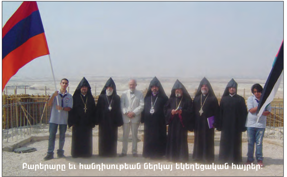
Բարերարը եւ հանդիսութեան ներկայ եկեղեցական հայրեր: