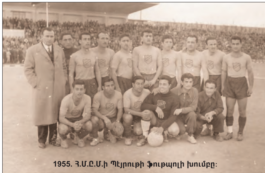
1955. Հ.Մ.Ը.Մ-ի Պէյրուսի ֆուտպոլի խումբը:

«Անցեալ Կիրակի տեղի ունեցաւ Հ.Մ.Ը.Մ-ի մրցումը Ռընեսանս-Սփորթիվի հետ, այս վերջնոյն դաշտին վրայ, հակառակ անոր որ որեւէ յայտարարութիւն եղած չէր. հետաքրքիրներու հայ բազմութիւն մը ժամա-