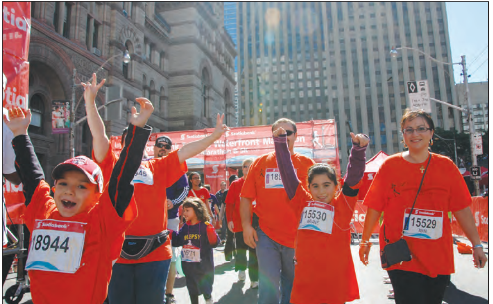
Երիտասարդական Կեդրոն, յառաջիկայ տարի դարձեալ մասնակցելու խոստումով:

Բոլոր մասնակցողներուն մօտ զգալի էր յուզումը: Անոնց շապիկներուն վրայ գրուած էր «Կը յիշենք ձեզ»: Ժամանման գիծ հասնելով, Հ.Մ.Ը.Մ.ական քոյրերն ու եղբայրները տեսան իրենց դիմաց պարզուած Հայաստանի եւ Հ.Մ.Ը.Մ. դրօշակները: Անոնք բարձր տրամադրութիւններով վերադարձան Հայ