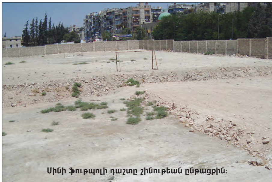
Սինի ֆութպոլի դաշտը շինութեան ընթացքին:

- Մարզալանին հողաչերտը, որ կը գտնուի Պուսթան Ալ-պաշայի շրջանին մէջ, Հայ Ծերանոցին դիմաց, Հ.Մ.Ը.Մ-ին