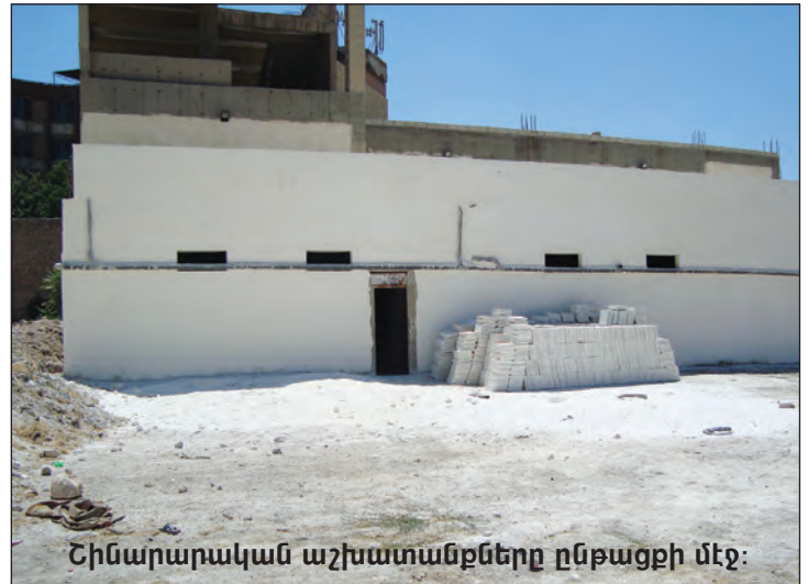
Շինարարական աշխատանքները ընթացքի մէջ:

մարզաւանի բաժիններուն շինութիւնը, ըստ անհրաժեշտութեան, եւ լիայոյս ենք որ մօտ ապագային հալէպահայութիւնը կը վայելէ մարզաւանը իր ամբողջական վիճակով: