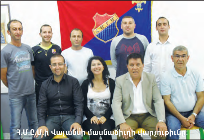
Հ.Ս.Ը.Մ.ի Վալանսի մասնաճյուղի վարչուիթիւնը:

Հաւանականութիւնը ունի՞ք այս տարի դասակարգ մը եւս բարձրանալու եւ լիկի մակարդակին անցնելու: