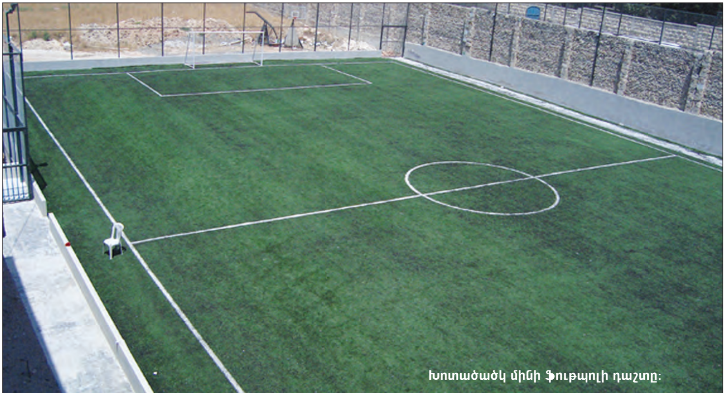
Խոտածածկ մինի ֆուտպոլի դաշտը: