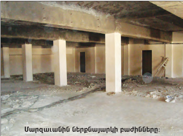
Մարզաւանին ներքնայարկի բաժինները: