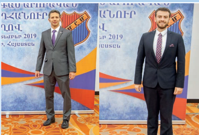
Հ.Մ.Ը.Մ.Ի Սիւնիխի եւ Վիեննայի մեկուսի շրջաններու պատգամաւորները: