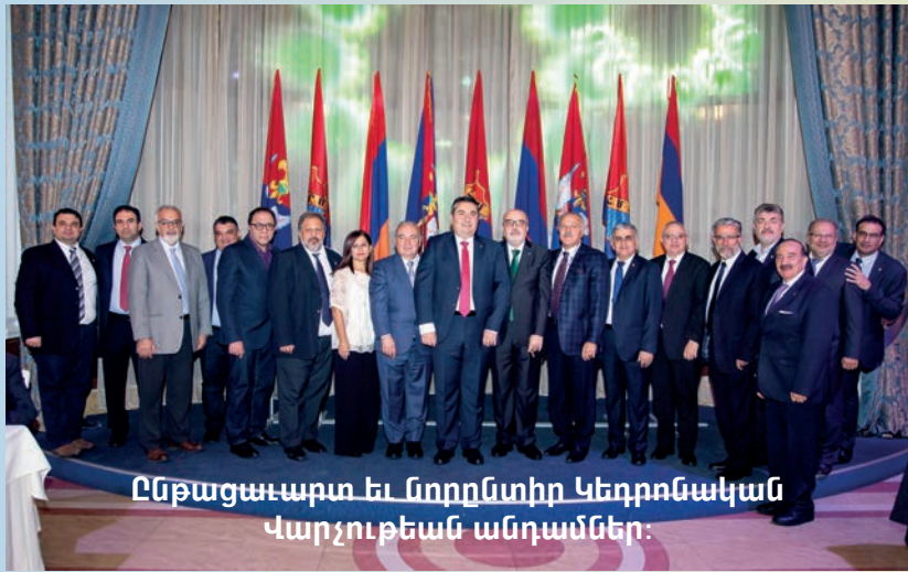
Ընթացաւարտ եւ նորընտիր Կեդրոնական Վարչութեան անդամներ:

Ժողովը մանրամասն քննութեամբ անդրադարձաւ անցնող քառամեակին իրագործուած միութեան համա-Հ.Մ.Ը.Մ.ական 10-րդ մարզախաղերուն, Համա-Հ.Մ.Ը.Մ.ական 11-րդ ընդհանուր բանակումին եւ միութեան 100-ամեակի ձեռնարկներուն: