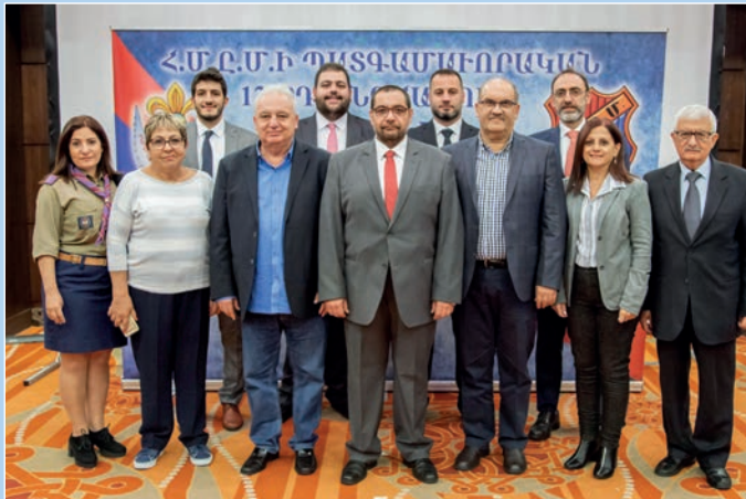
Հ.Մ.Ը.Մ.ի Լիբանանի շրջանի պատգամաւորական կազմը: