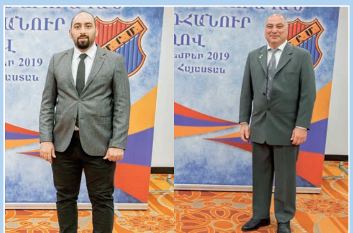
Հ.Մ.Ը.Մ.Ի Պաղտատի եւ Ալմէլոյի մեկուսի շրջաններու պատգամաւորները: