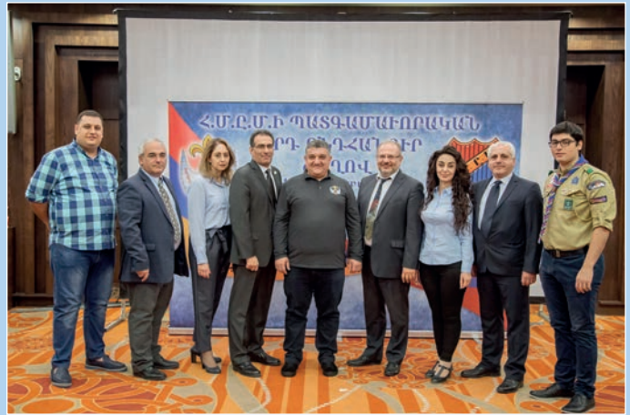
Հ.Մ.Ը.Մ.-Հ.Ա.Ս.Կ.ի պատգամաւորները շրջանի Կեդրոնական Վարչութեան անդամներուն հետ: