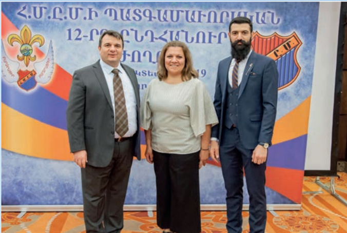
Հ.Մ.Ը.Մ.Ի Շուևտի՝ Սթրոնիլմի եւ Ստտերթելիոյ պատգամաւորները: