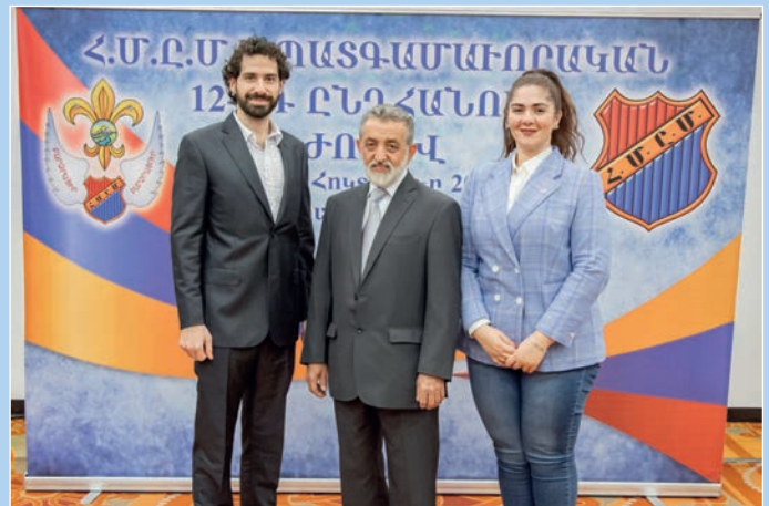
Հ.Մ.Ը.Մ.Ի Քուէյթի մեկուսի շրջանի պատգամաւորները: