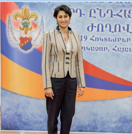
Հ.Ս.Ը.Ս.ի Պուլկարիոյ շրջանի պատգամաւորը: