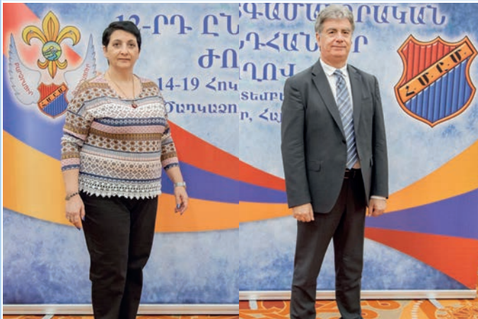
Հ.Ս.Ը.Ս.ի Յունաստանի եւ Կիպրոսի մեկուսի շրջաններու պատգամաւորները: