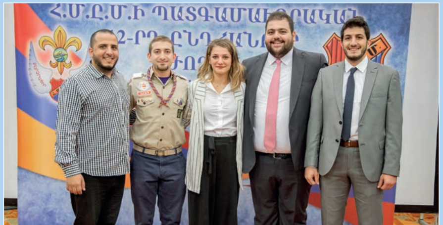
Հ.Ս.Ը.Ս.ի երիտասարդական համագումարէն հրաւիրեալ երիտասարդ պատգամաւորները: