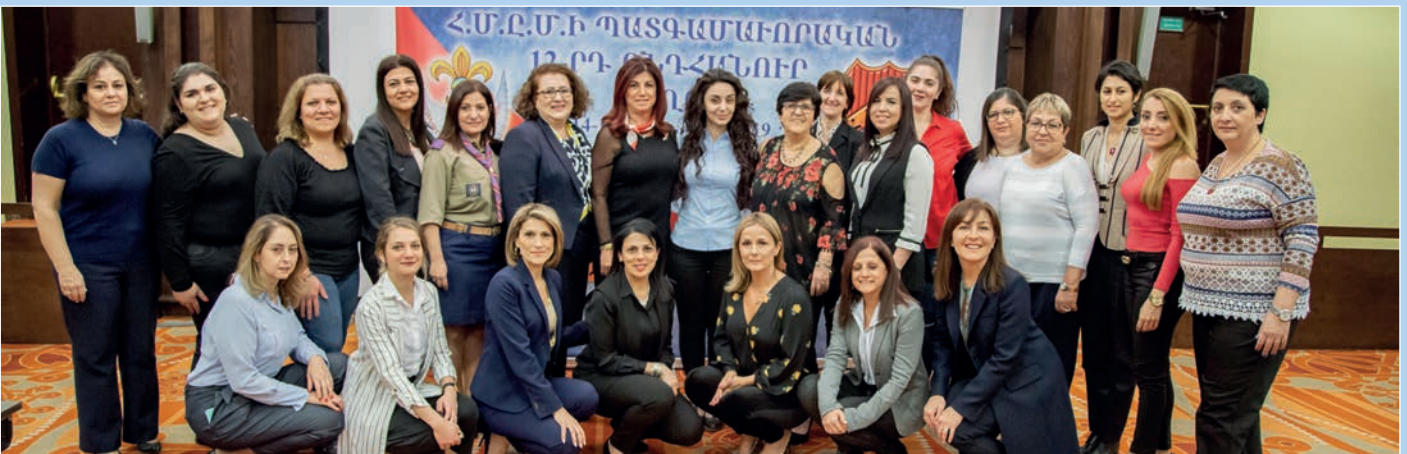
Հ.Ս.Ը.Ս.ի ԺԲ. Պատգամաւորական Ընդհանուր Ժողովին մասնակից քոյրերը: