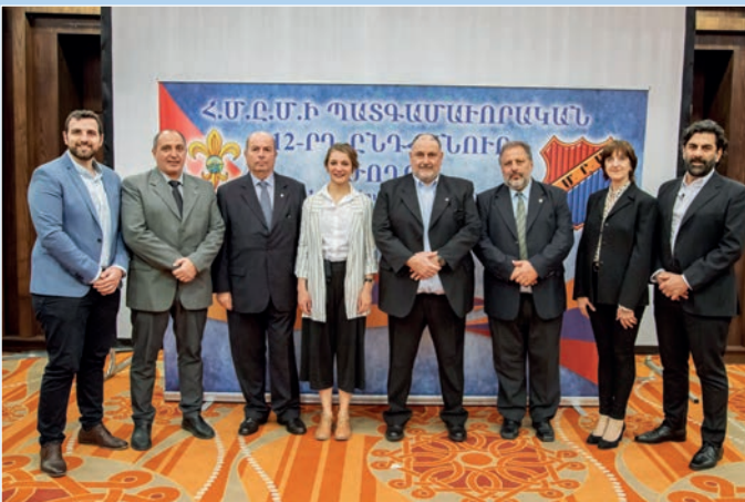
Հ.Ս.Ը.Մ.ի Հարաւային Ամերիկայի պատգամաւորական կազմը շրջանի Կեդրոնական Վարչութեան ներկայացուցիչին հետ: