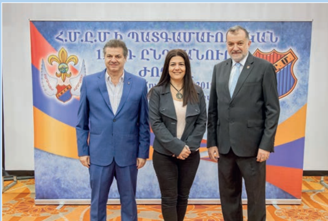
Հ.Մ.Ը.Մ.Ի Գահիրէի մեկուսի շրջանի պատգամաւորները: