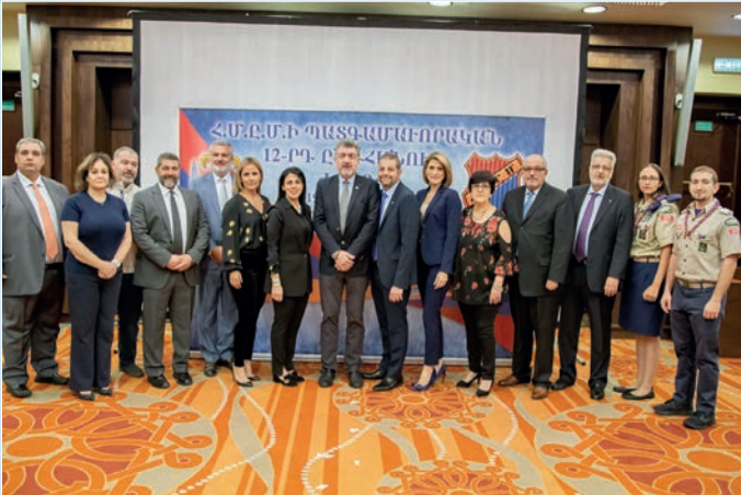
Հ.Ս.Ը.Մ.ի Արեւմտեան Մ. Նահանգներու պատգամաւորական կազմը շրջանի Կեդրոնական Վարչութեան ներկայացուցիչին հետ: