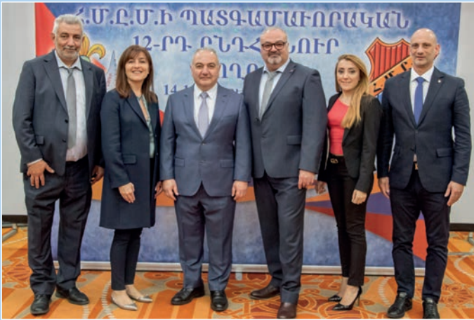
Հ.Մ.Ը.Մ.ի Աստրալիոյ շրջանի պատգամաւորական կազմը: