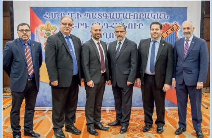
Հ.Ս.Ը.Մ.ի Արեւելեան Մ. Նահանգներու պատգամաւորական կազմը շրջանի Կեդրոնական Վարչութեան ներկայացուցիչին հետ: