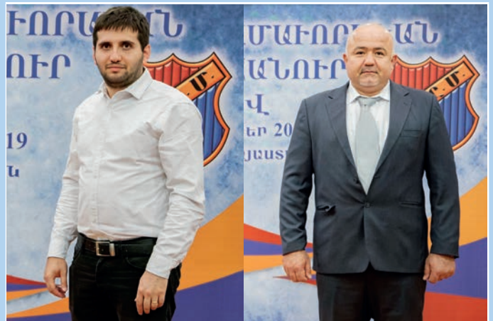
Հ.Ս.Ը.Ս.ի Թիֆլիսի եւ Արցախի մեկուսի շրջաններու պատգամաւորները: