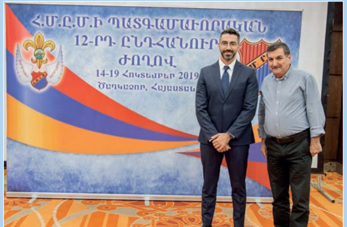
Հ.Մ.Ը.Մ.Ի Երուսաղէմի մեկուսի շրջանի պատգամաւորները: