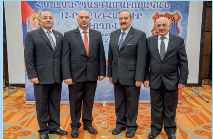
Հ.Մ.Ը.Մ.ի Սուրիոյ շրջանի պատգամաւորական կազմը: