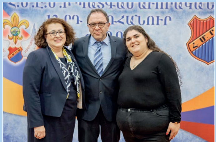
Հ.Մ.Ը.Մ.ի Լոնտոնի պատգամաւորները շրջանի Կեդրոնական Վարչութեան ներկայացուցիչին հետ: