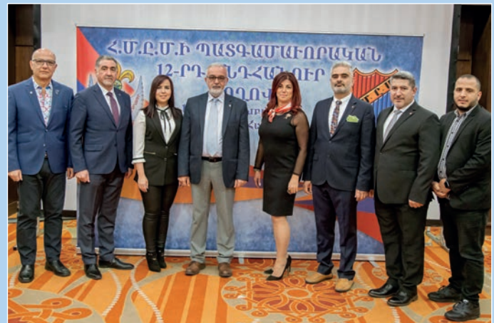
Հ.Ս.Ը.Մ.ի Գանատայի պատգամաւորական կազմը շրջանի Կեդրոնական Վարչութեան ներկայացուցիչին հետ: