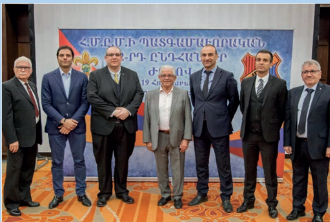
Հ.Մ.Ը.Մ.ի Ֆրանսայի՝ Փարիզի, Մարսէյի եւ Վալանսի պատգամաւորները շրջանի Կեդրոնական Վարչութեան ներկայացուցիչին հետ: