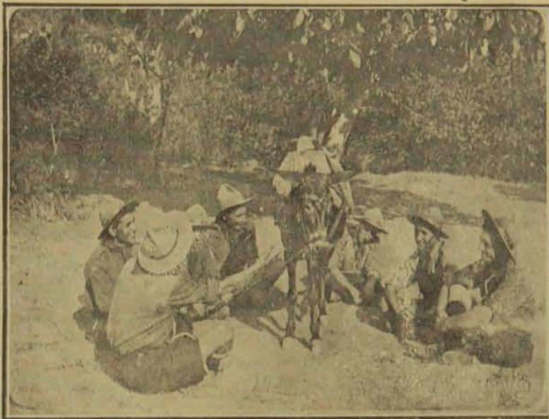
Բերայի սկաուտներէն խմբակ մը, 1921

2 Լասիներ, որոնք 1918 թուականին կազմակերպուած են ու կը կառավարուին անգլիացի խմբապետէ մը Mr. Baiker անունով: