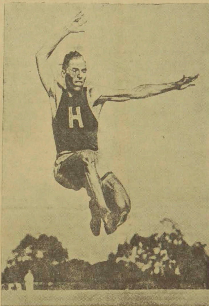
Կ Ո Ւ Ռ Տ Է Ն

ցումներու միջոցին քանի մը մրցումներու ռէքորդ կտրեցաւ Տրնբլոն 400 վազած ասէն առաջին 300 մեթրը 345/10 էն առաւ բակայն ամերիկայի Մէյլոս 1881 ին 330 եռոտան 33 երկ. առաւ և Բաստոնք 300