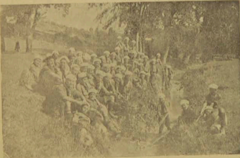
Շայ սկառաւներ. 1921

Սակայն, որպէսզի առաջնորդը կաթինայ լաւ առաջնորդել, պէտք է ինքն ալ լաւ դաստիարակուած ու առաջնորդուած ըլլայ. եթէ չէ եղած թող փորձէ ինքզինքը մարդել ուրիշներէն ներշնչուելով: