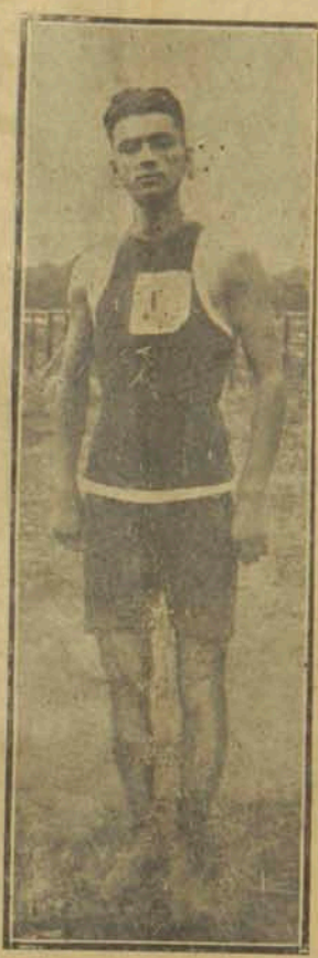
Ա. Գաղճեան Մէկ քանգրամ էր քիմիական քննարկումը 201,04 քանգրամ ԱՌԱՋԻՆ ՕՐՈՒԱՆ ՅԱՂԹԱԿԱՆ