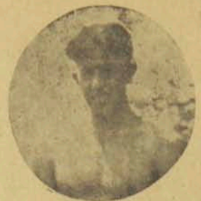
Բ. Տամխանան 200 եւ 400 մեթր յողայու Առաջին