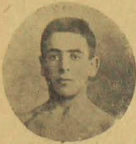
Ա. Փելիպանան յողայու 100 մեթրի Ա. (կրեակի վրայ) եւ 1500 մեթրի Բ.