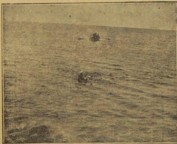
մեր մեծակայ մարզիկը, 1500 մեթր յողայու Ա.