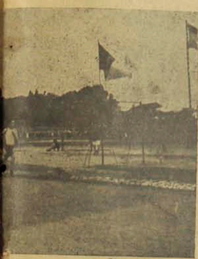
Մեր տնտեսական մրցումը