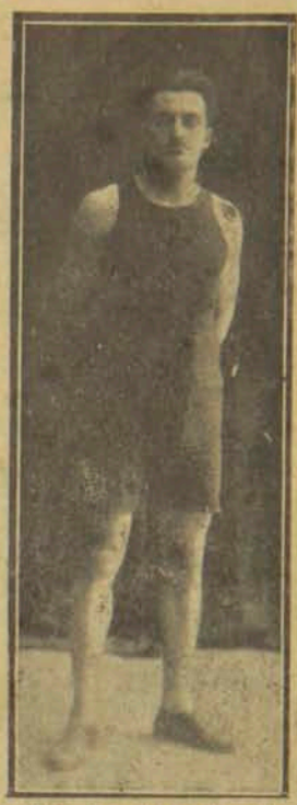
Ա. Մաւրիանիան 3000 մետր 4,02-րդ 5000 մետր 2-րդ և 3-րդ ԱՌԱՋԻՆ