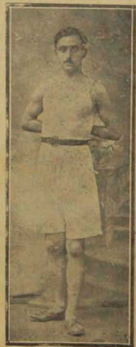
Ա. Գաղճեան Մրցողի քիմիական քննարկումը ԱՌԱՋԻՆ