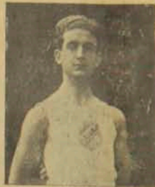
Ս. ՎԷԼԷՏԵԱՆ Օրուան ճագրակահր