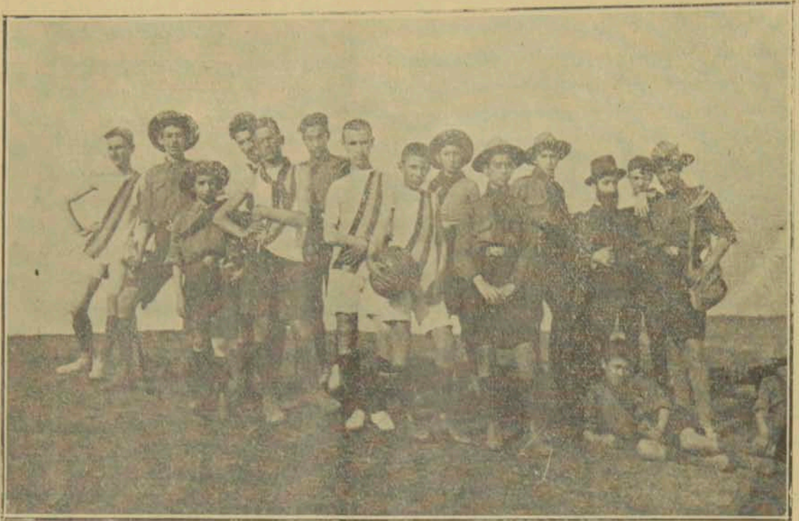
Բերայի վեներիկեան մսիքարեան վարձարանի սկաուտները արշաւի միջոցին:

Ճանրութիւնը կ'զգան և պատասխանատուութեամբ քեանաւորուծ են: Չեն կարող ըմբռնել թէ ինչպէս կարկի է կեանքը այսքան զուարթօրէն դիտել: Այն տպաւորութիւնը կը թողուն թէ եթէ իրենք չըլլային աշխարհ կանգ պիտի առնէր: Անոնք լուրջ ու վշտաբեկ են, իբր թէ աշխարհ իրենց ուսերուն վրայ հանգչէր: