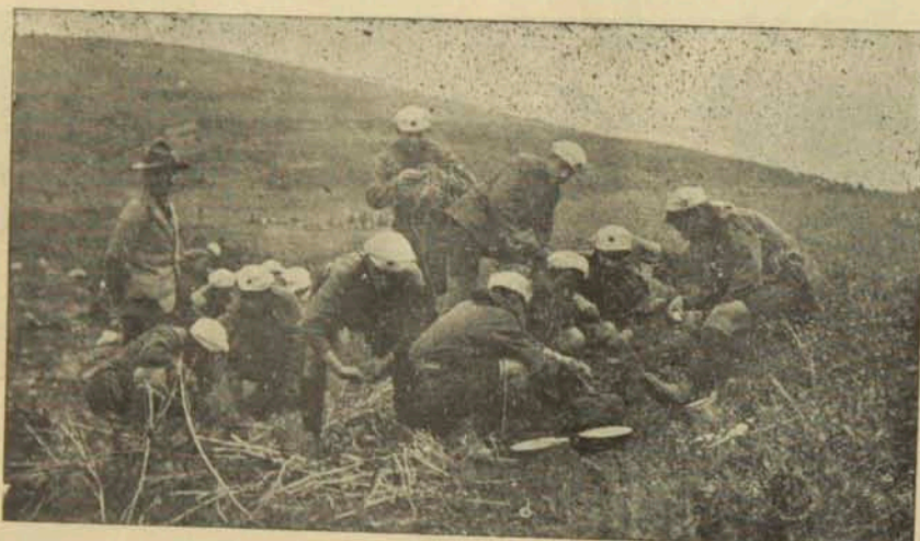
Հայ սկսուսներ «Գայիշ Տաղի» արշաւին մէջ

Մայիս 21 կիրակի օրուան համար հայ սկսուսները արշաւ մը կազմակերպած էին դէպի բաց դաշտը «Գայիշ տաղի» 9-10 քիլոմէթր հեռաւորութեամբ տեղ մը: Շատ օրեր առաջ իսկ, երբ հաճոյքը կ'ունենայի սովորաբար հանդիպելու փոքրիկ բարեկամներու, բնաւ չէին մտնար, մէկ խօսք բրածի պէս, ըսել ինծի: «Պարոն, արդեօք կիրակի օրը պիտի բնկիրանա՞ք մեզի»: Անկեղծ նայուածքի մը տակ այս անուշիկ հրաւերը արդէն իր հրապոյրը ունենալով ինձ համար, վայրկեան մը չ'էի կրնար վարանիլ ոչլեւս: Շարաթ իրիկուրէն կը փութամ հաւաքավայրը Ակիւտար, ուր գիշերը անցնելէ վերջ, խմբովին ճամբայ կ'ելլենք լուսածագին: