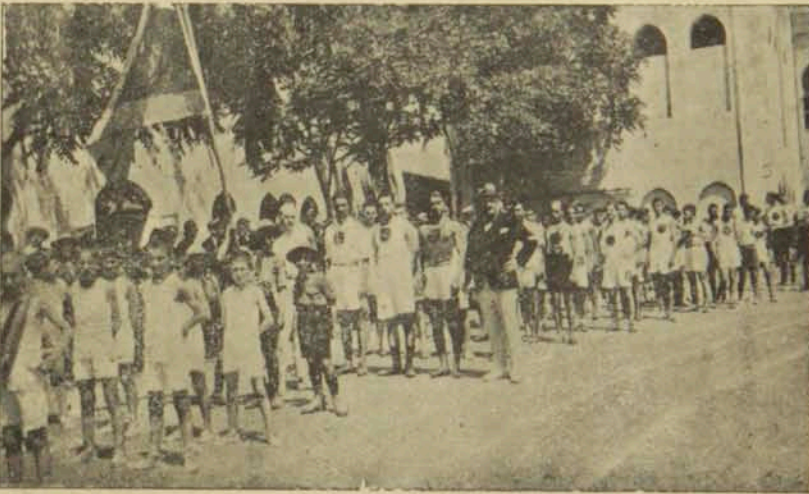
Հայ մարզիկներու տողանցքը

Գ. — Նկատելով որ հակառակ մեր դատաւորներու կողմէ կատարուած դիմումներուն թէ՛