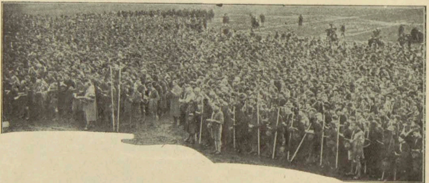
Միջազգային սկաուտները պոօմփի պահուն: