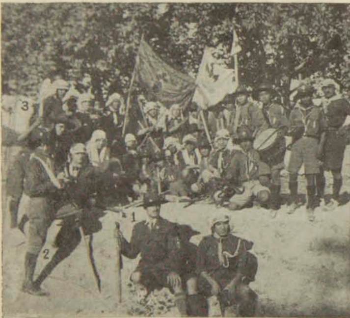
Վամասկոսի Հ. Մ. Ը. Մ. Ի սկաուտները, արարական «Ղուծա» խմբի սկաուտներուն հետ գէպի Մաարապա գիւղը, արշաւի միջոցին: