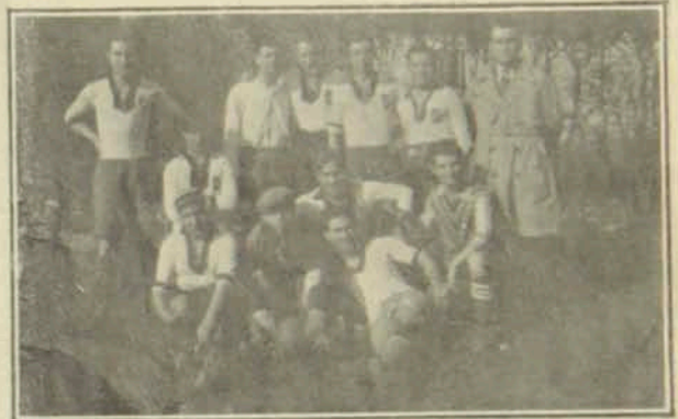
Հ. Մ. Ը. Մ.ի Փարիզի ֆուտպօլի խառն խումբի պահեստին: