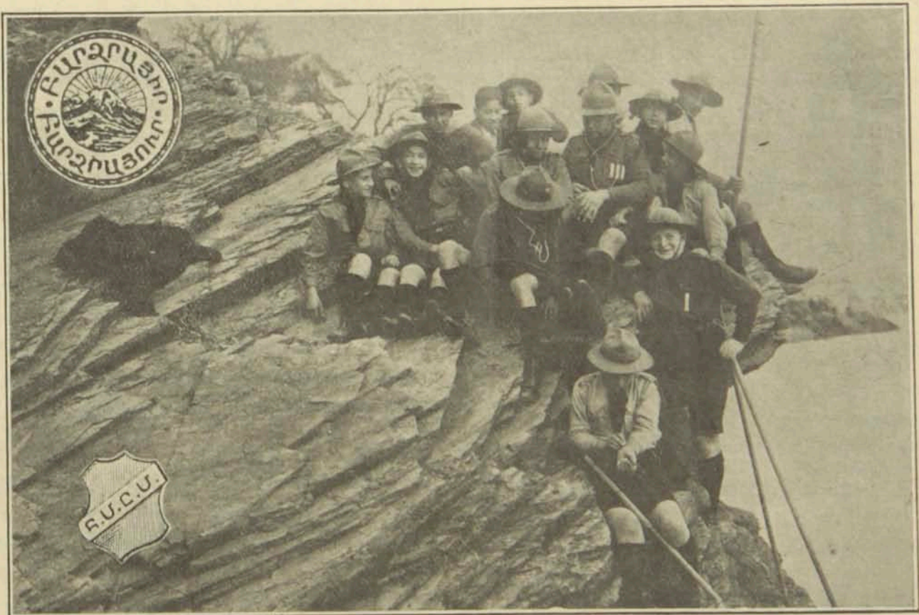
Շայ սկաուտները թնութեան ծոցին մէջ: