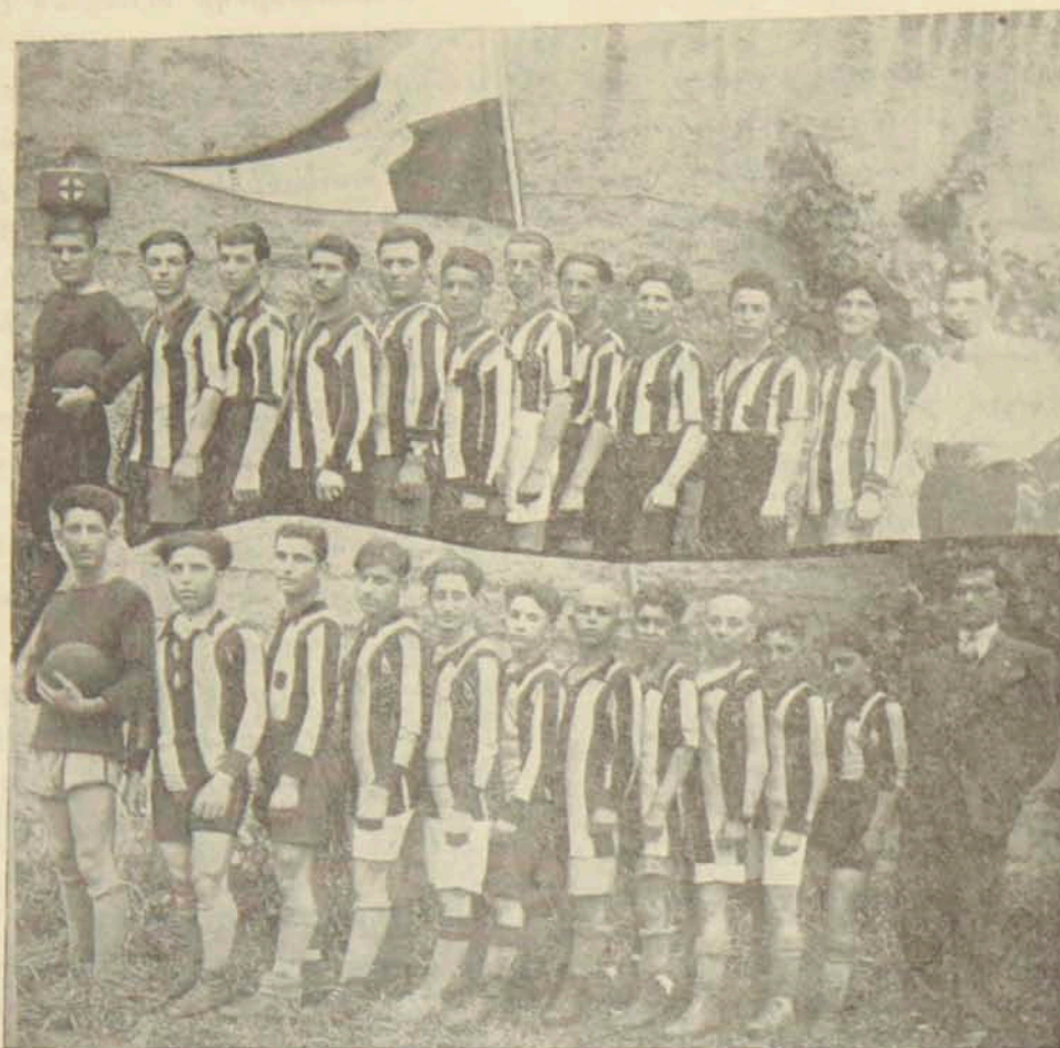
ՏԷՍԻՆԻ ՖՈՒԹՊՈՒԼԻ Ա. ԵՒ Բ. ԹԻՄԵՐԸ