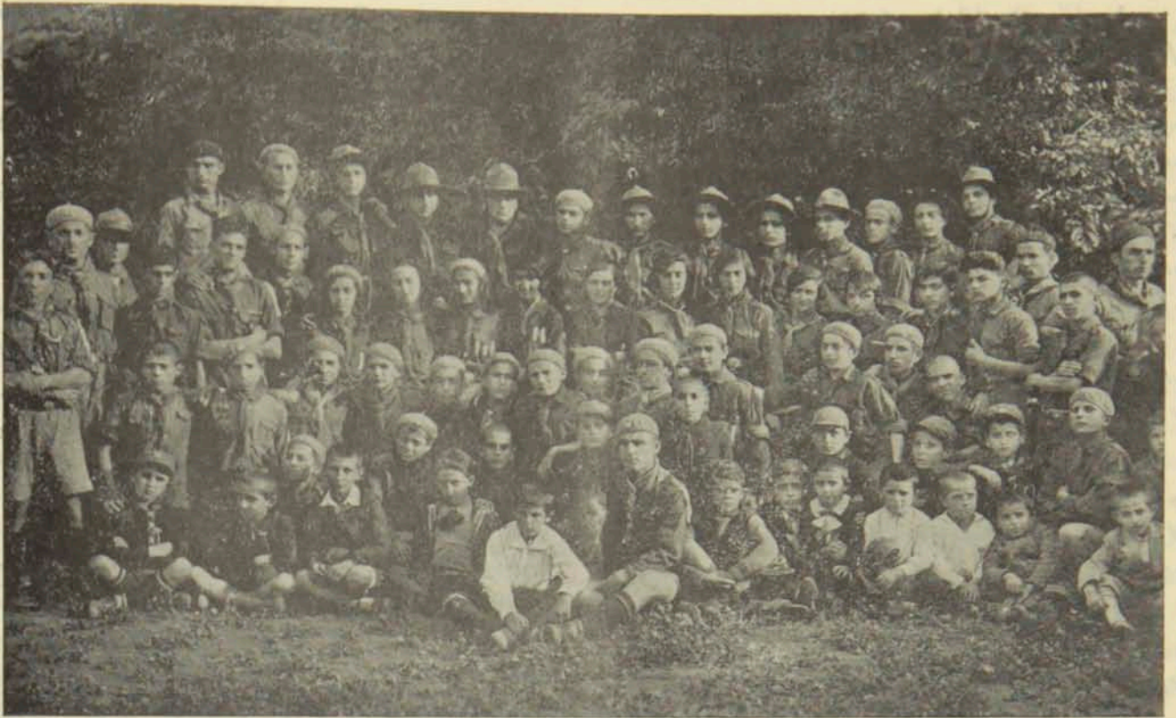
ՖԻԼԻՊԻՆԻ ԵՒ ԹԱԹԱՐ-ՊԱՋԱՐՃՐԳԻ ՍԿԱՈՒՏՆԵՐԸ ԵՂ ԲԱՅՐԱԿԱՆ ԿԱՄԱԽԱՐԵՈՒՄԻ ՄԵՐ ԱՌԹԻՆ ՆԿԱՐՈՒՄԸ