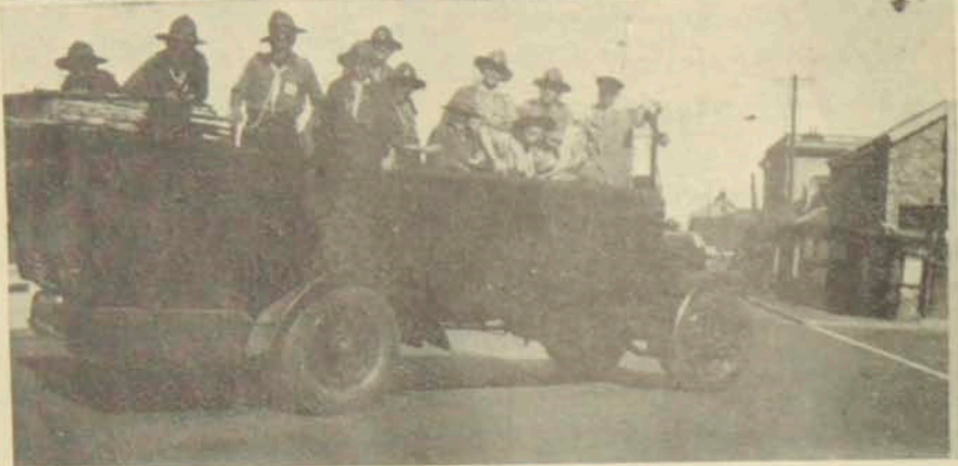
Մեր սկաուտները Անգլիոյ մէջ

մասնագիտօրէն դրադեցաւ տղոց հետ, հետախուզական և ուրիշ սկաուտական մասնագիտական դասեր աւանդելով գործնական կերպով: Ա. և Բ. կարգի ու նորրնձայի քննութիւններ անցուցին շատեր, իսկ Երէցներն ալ իրենց երզումը կատարեցին հոն: