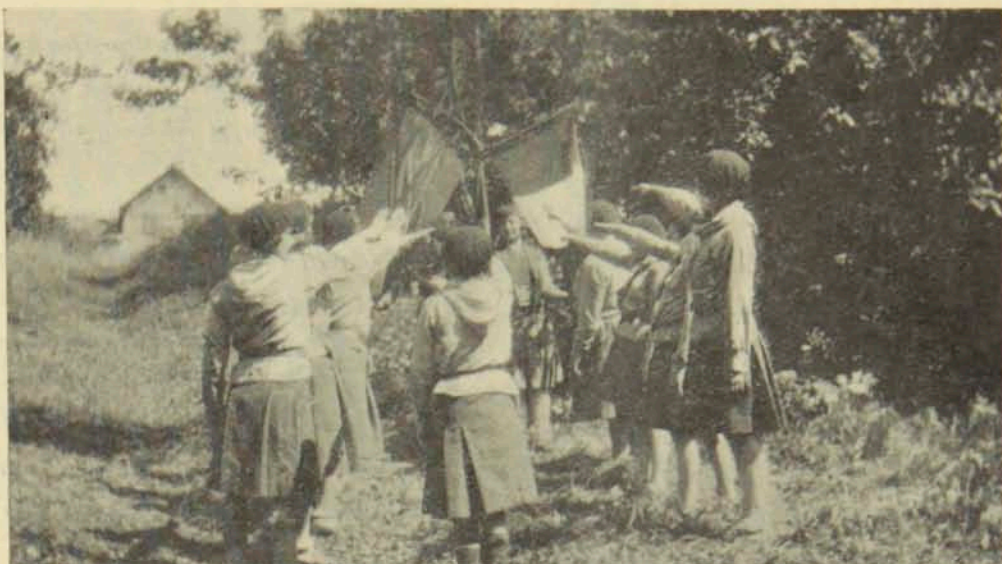
Սկառուտուհիներու բանակումը վերվիլի մէջ