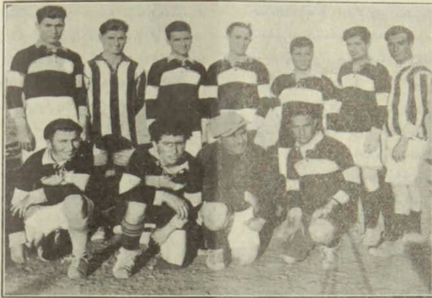
Զահիլի Լ. Մ. Ը. Մ. ի ֆութպոլի խումբը

մա, և ալլն: Փոքրամասնութիւն մը կայ սակայն որ ի ծնէ մեզ հայերու հետ ապ- րած ըլլալով չեն բաժնուիր մեզմէ: Ա- սոնց կարգէն թուենք Խալիլ Ռուհանի, ընիկ Զահէլցի Երիտասարդը, բառ մը հայերէն չէր գիտեր, հիմա ոչ թէ միայն կը խօսի ալլ և գինքը հայ մկրտած ենք