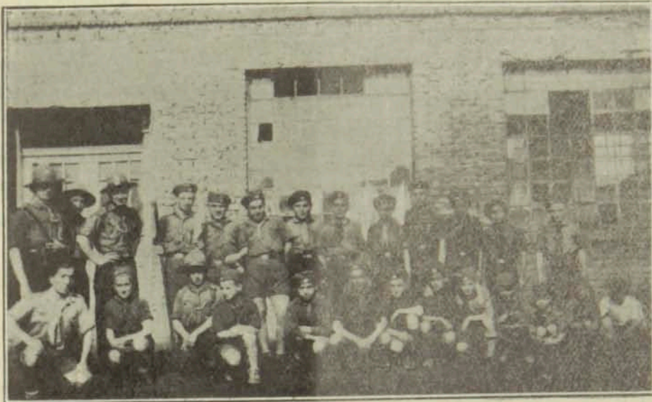
ԹԱԹԱՐ - ԲԱԶԱՐ ՃԸՔ Է. Մ. Ը. Մ. -ի Սկսուած - Գայլուկները

զամ ձեզ տեղեկացնել թէ հաճութեամբ և ստանց վերապահութեան ամէն սք լըծ- ուած է շ. Մ. Ը. Մ. -եան աշխատանքին: Ոչ մէկ քէն ու ըսի - ըսաւ. միաձույլ կամք մը ստեղծուած է, որուն հեռեւանքով չարթուս ընթացքին սկսուածներու թիւը նշանակելի յաւելում մը կրեց: