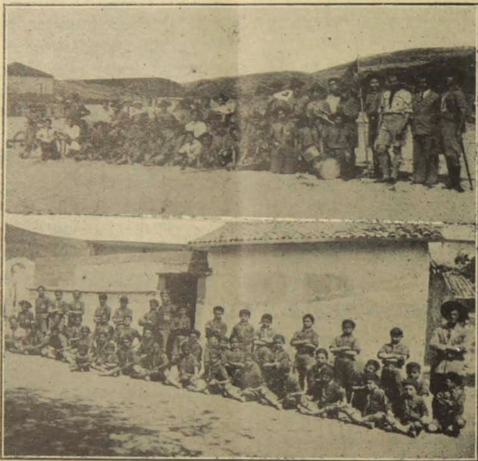
ՍՈՒՐԻՈՅ ՇՐՋ . ՊԵՅՐՈՒԹԻ ԵՒ ԳԸՐԸՔ - ԽԱՆԻ ՍԿԱՌԻՏՆԵՐԸ

Թերեւս ըսուի թէ յետպատերազմեան չըջանի աւերներն են ասոնք : Կը հարցը- նեմ , մեր բնակելիք տունը , յոյսը եւ պա- տըսպարանը , կրնա՞նք բազդին թողուլ որ