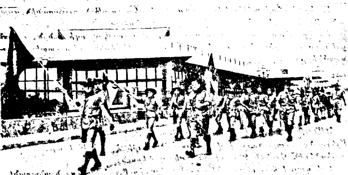
Ս. Բալայի սկստունքը տողանցք